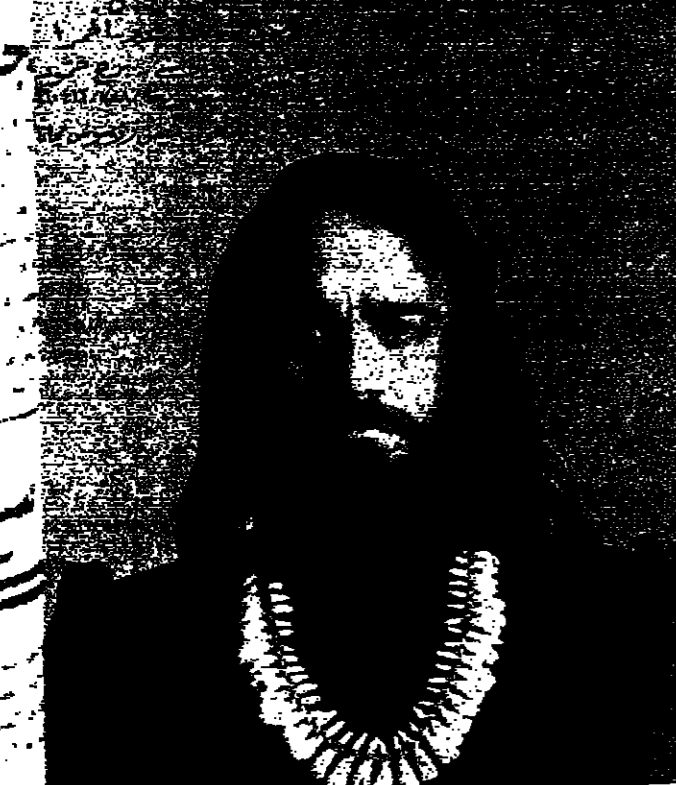
تحت إشراف... كنت

ان اسرائيل تدعو الى استبعاد لعرض الهاشمية، وستكون النتيجة هي ما يطلق عليه الاسرائيليون اسم «توزيع» وطني للسلطة، وهو تغيير يبدو انه متصور لقطاع غزة... وأضحت الصيحة ان هذا جهدا كبيرا من التفكير الخيالي وايضا اعطى بصحة موقفه دايم وزملاؤه يمكن ان يفسروا اعتقاد هؤلاء بان هذه الاقتراحات قد تستجيب في المستقبل للظهور بتقديم اساسي لتسوية... لندن - ر